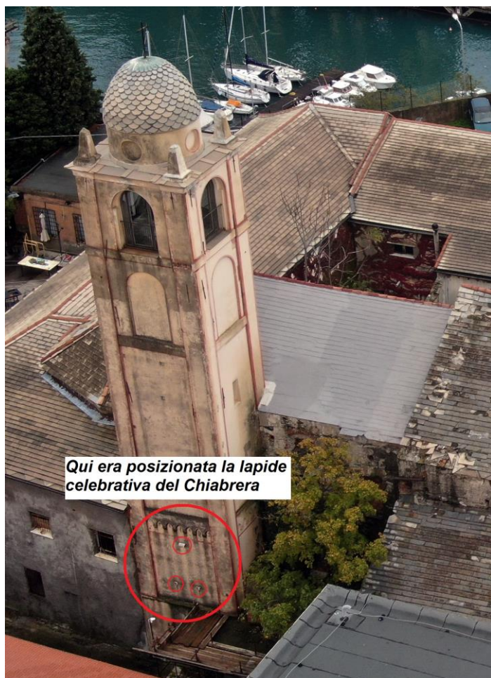
Qui era posizionata la lapide celebrativa del Chiabrera