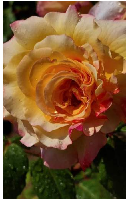
Cespugli di rose dietro al bunker