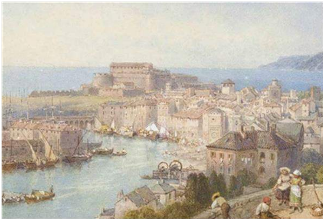
Birket Foster , veduta di Savona dal san giacomo (Collezione Privata ,Villa della Pergola in Alassio)

Dallo stesso belvedere, con i delicati pennelli di celebrato socio della Royal Watercolourist Society il pittore Birket Foster ritraeva l'antica città medievale affacciata sul porto, la vecchia darsena con la sua foresta di velieri, barche di pescatori e, a dominare la solare scena mediterranea, la severa fortezza genovese".