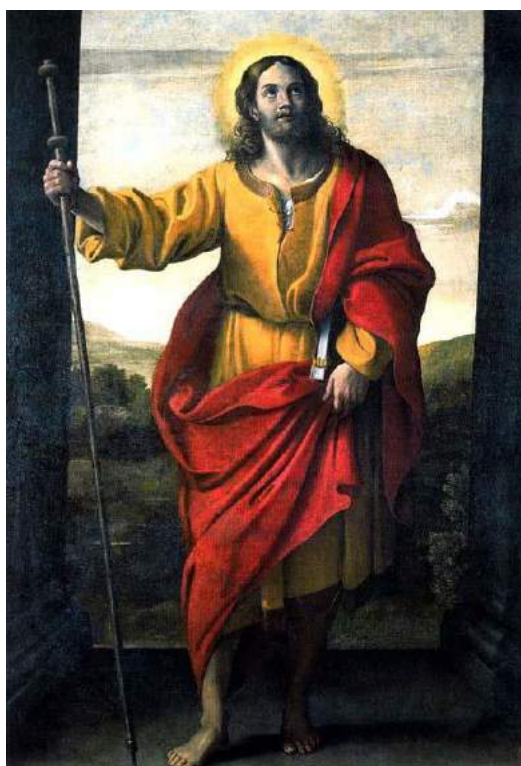
Innocenzo Tacconi, S. Giacomo il maggiore, 1632, Galleria d'arte antica, Roma