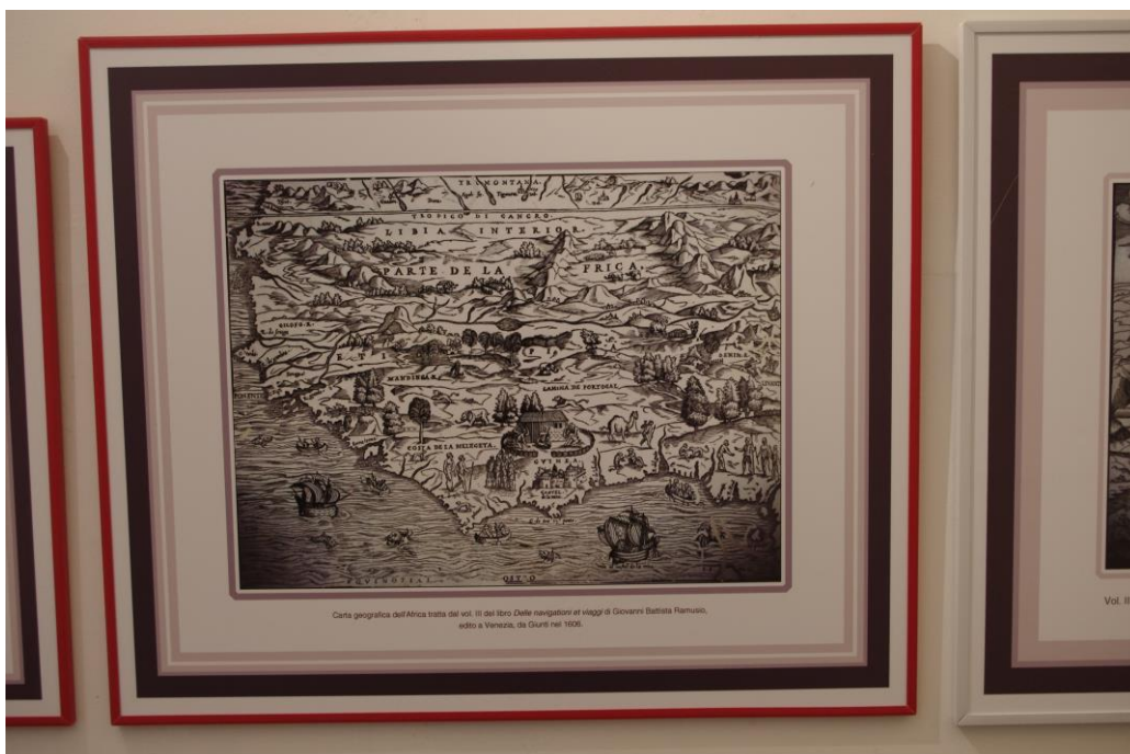
Carta geografica dell'Africa tratta dal vol. II del libro Delle navigationi et viaggi di Giovanni Battista Ramusio, edito a Venezia, da Giunti nel 1590.