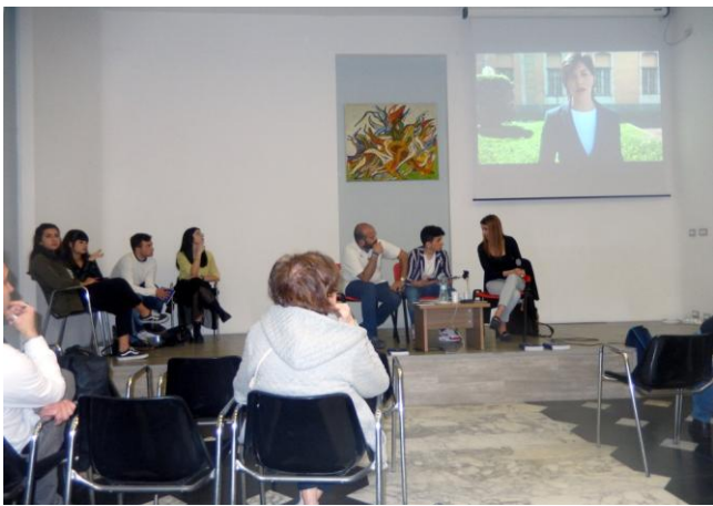
Omaggio a Gabriello Chiabrera