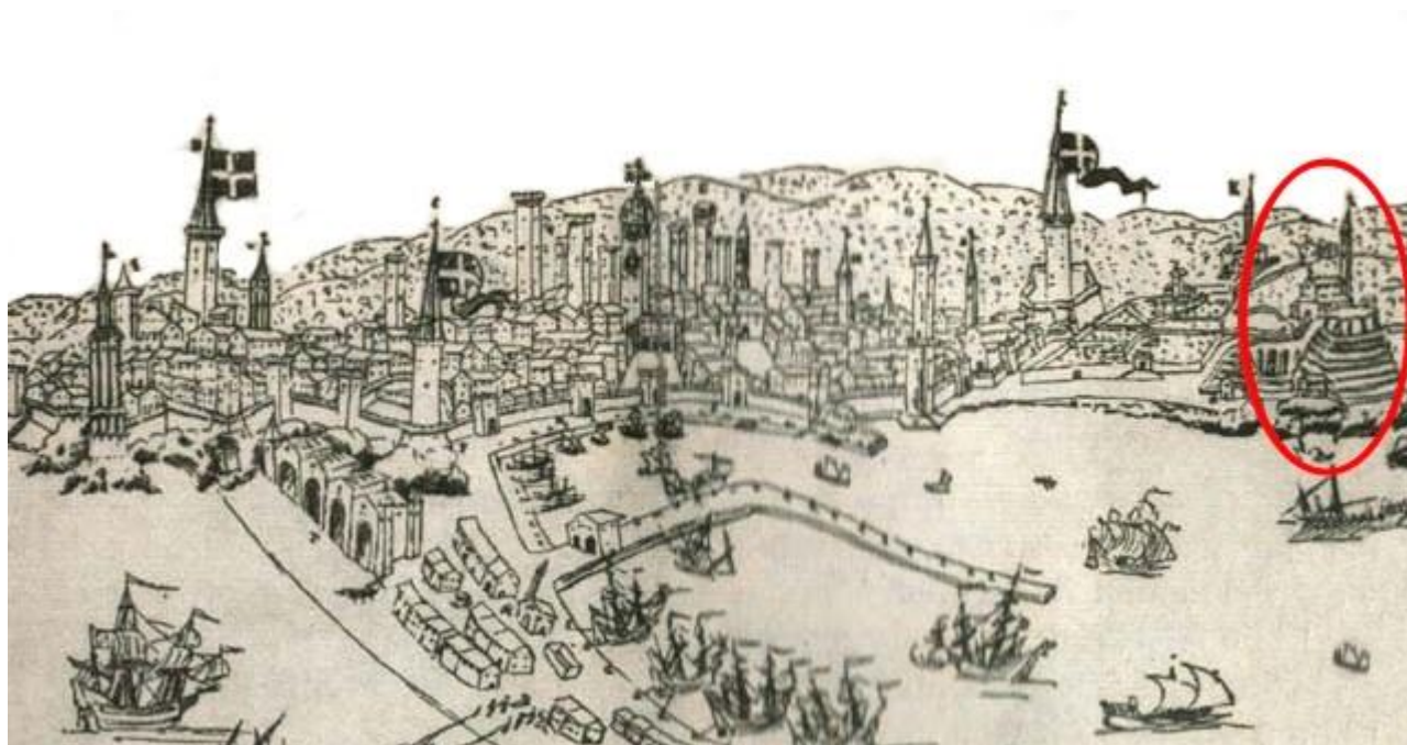
Savona nel 1500